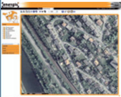
WebGIS bei der energis GmbH