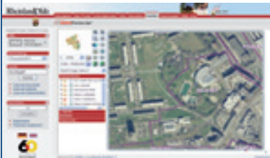
WebGIS beim Land Rheinland-Pfalz